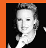
Por Mª Carmen Cazcarra Directora de Cazcarra Image Group